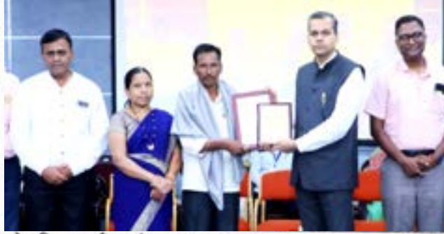
सेवानिवृत्त कर्मचाऱ्यांचा सत्कार करताना कुलगुरू

संत गाडगेबाबा अमरावती विद्यापीठातील कर्मचाऱ्यांच्या सेवानिवृत्तीप्रसंगी आयोजित कर्तव्यपूर्ती सोहळ्यात अध्यक्षस्थानावरून ते वॉलंत होले व्यासपीठावर कुलसचिव डॉ.