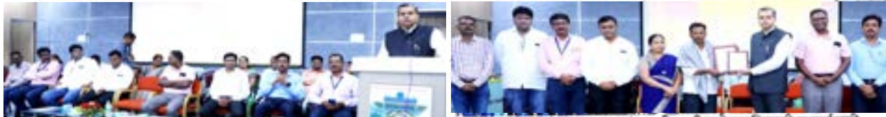
निरोप समारंभाप्रसंगी मार्गदर्शन करताना कुलगुरु तर दुसऱ्या छायाचित्रात सत्कारमूर्तीचा सत्कार करताना कुलगुरुंसह विद्यापीठाचे पदाधिकारी व कर्मचारी.