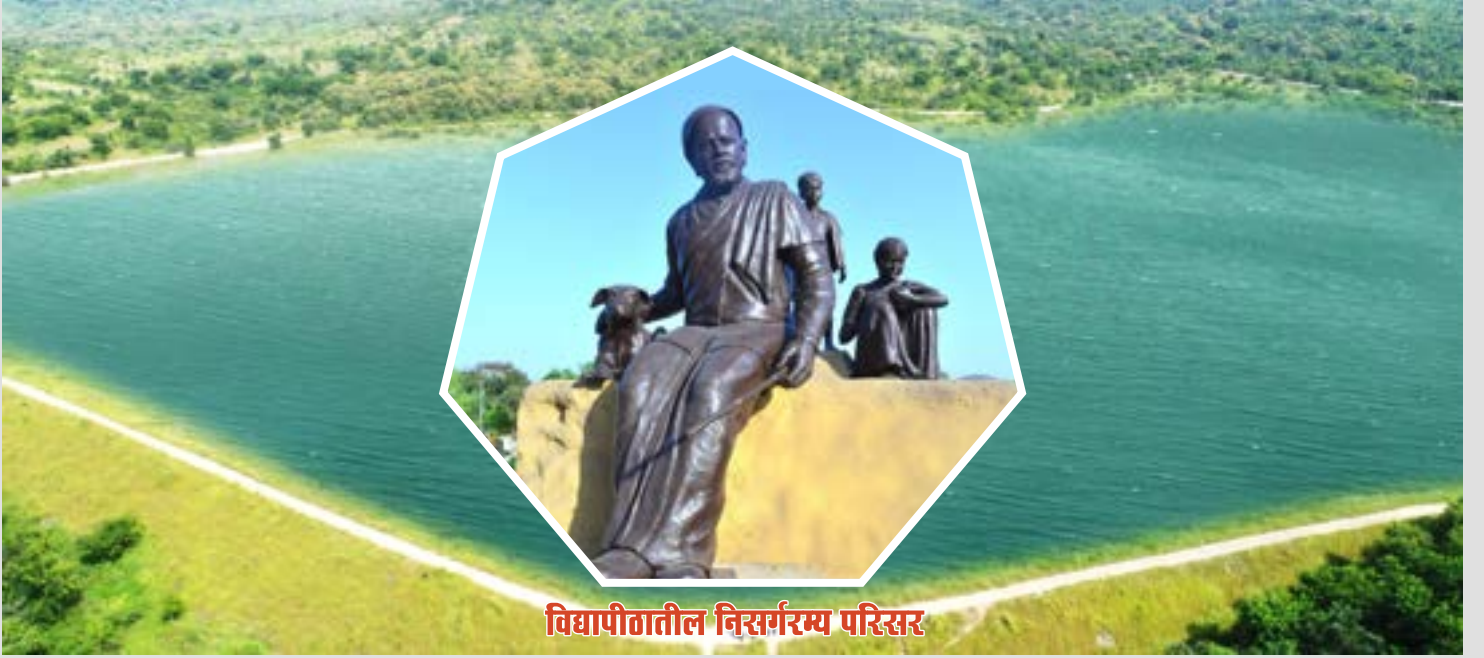
विद्यापीठातील निसर्गरम्य परिसर