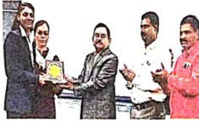
मान्यवरांच्या हस्ते पुरस्कार स्वीकारताना खेळाडू.

पुढे बोलताना प्र-कुलगुरू म्हणाले, कार्यशाळेचा क्रीडा संचालकांना त्याचा मोठा लाभ